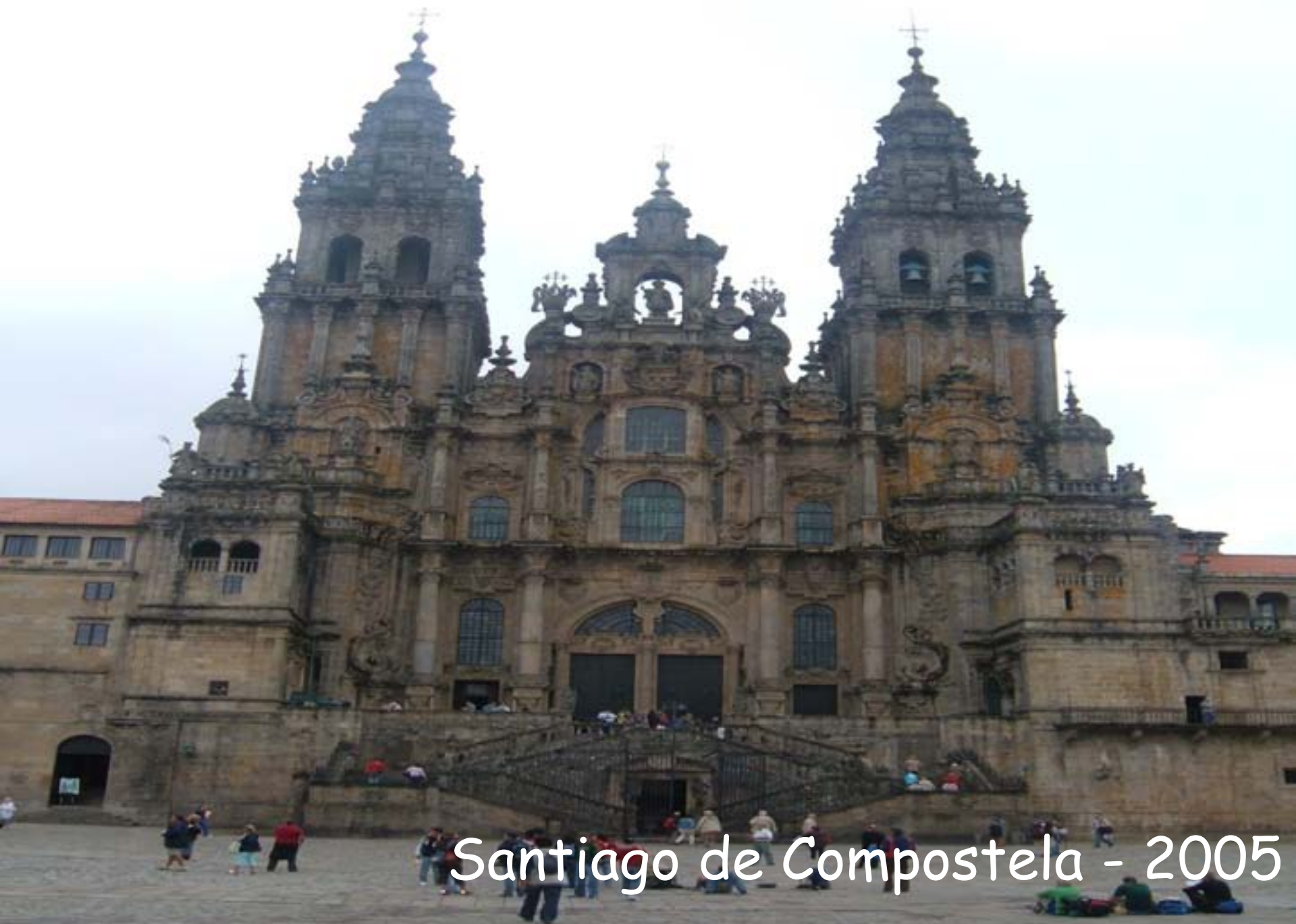
Santiago de Compostela - 2005