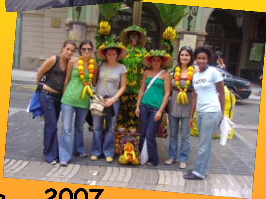
Barcelona - 2007